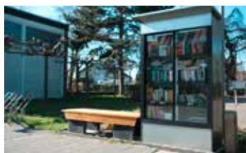
Wer Bücher liest, schaut in die Welt S. 28