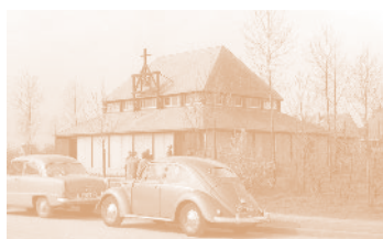
Neuanfang nach dem 2. Weltkrieg S. X