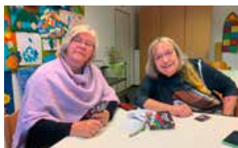
Gnadentaler Quartiersbüro S. 24