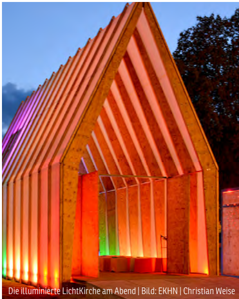
Die illuminierte LichtKirche am Abend

Für die Ausrichtung der Landesgartenschau gibt es eine eigene GmbH – die Fahnen hat sicher jeder schon einmal irgendwo in Neuss gesehen. Auf der Website der GmbH gibt es unter dem Stichwort „neugierig“ jede Menge Information rund um die Landesgartenschau und den neuen Bürgerpark: www.landesgartenschau-neuss.de