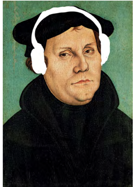
Martin Luther mit Kopfhörer von Katja Ulges-Stein

1852 erschien erstmalig ein einheitliches Gesangbuch mit 150 Kernliedern, die dann jeweils regional ergänzt wurden. Der Schwerpunkt lag auf Liedern des 16. Jahrhunderts, also aus der Anfangszeit der Liederdichtung. Besonders prominent vertreten waren Lieder von Martin Luther und Paul Gerhardt. Zurzeit wird wieder an einem neuen Gesangbuch gearbeitet, das in einigen Jahren erscheinen soll.