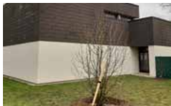
Baumfällung und Neupflanzungen S. 8