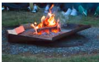
Jugendfreizeit auf Baltrum S. 15